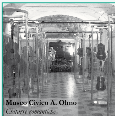
Museo Civico A. Olmo Chitarre romantiche