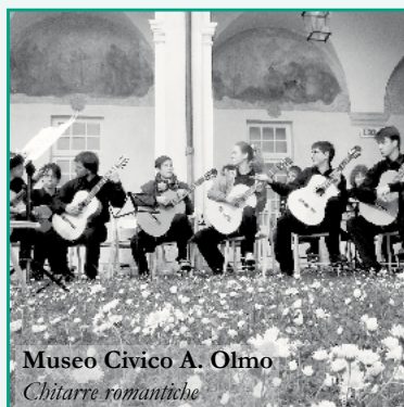
Museo Civico A. Olmo Chitarre romantiche

PER LA MUSICA, L'ARTE E CULTURA DEL TERRITORIO