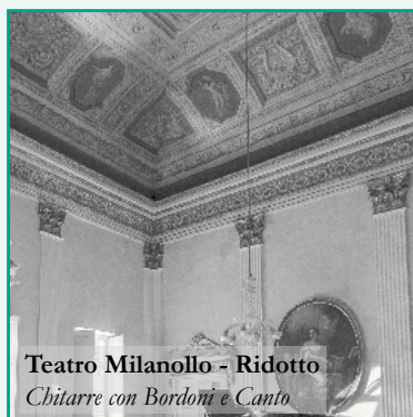
Teatro Milanollo - Ridotto Chitarre con Bordoni e Canto