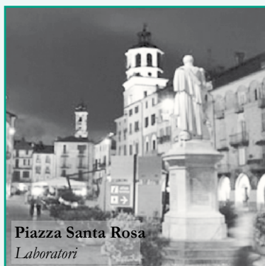
Piazza Santa Rosa Laboratori